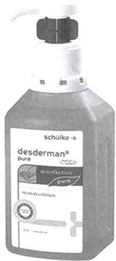
Für größere Ansicht Maus über das Bild ziehen

Desderman® pure hyclick Händedesinfektionsmittel, hyclick®-Spender-System, 500ml